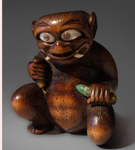
San Toman Netsuke figurant un Kappa mangeant un concombre, Japon

Civilisations – Brussels Art Fair du 5 au 9 juin • quartier du Sablon • civilisations.brussels